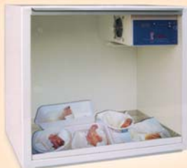
CAMERA calda mod. CIS DIGIT

utili come camere infermeria, indispensabili per l'allevamento allo stecco.