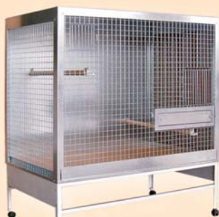
VOLIERA 1210x730x950 mm rete maglia 30x30 idonea per cenerini, pionus, amazzoni e parrocchetti di media taglia.