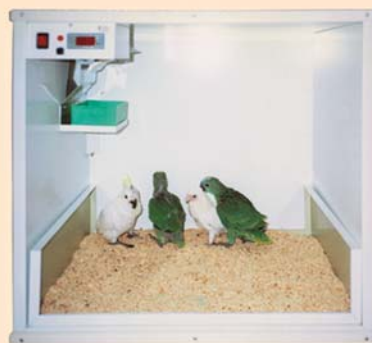
CAMERA calda mod. CIL