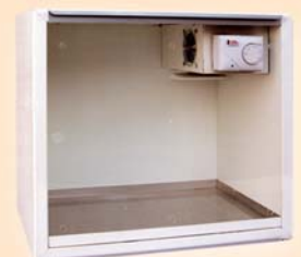
CAMERA calda mod. CIS base