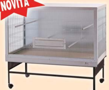
VOLIERA 1260x670x750mm rete maglia 102x12 ideale per alloggiare e riprodurre: indigeni, esotici e pappagalli di piccola taglia.