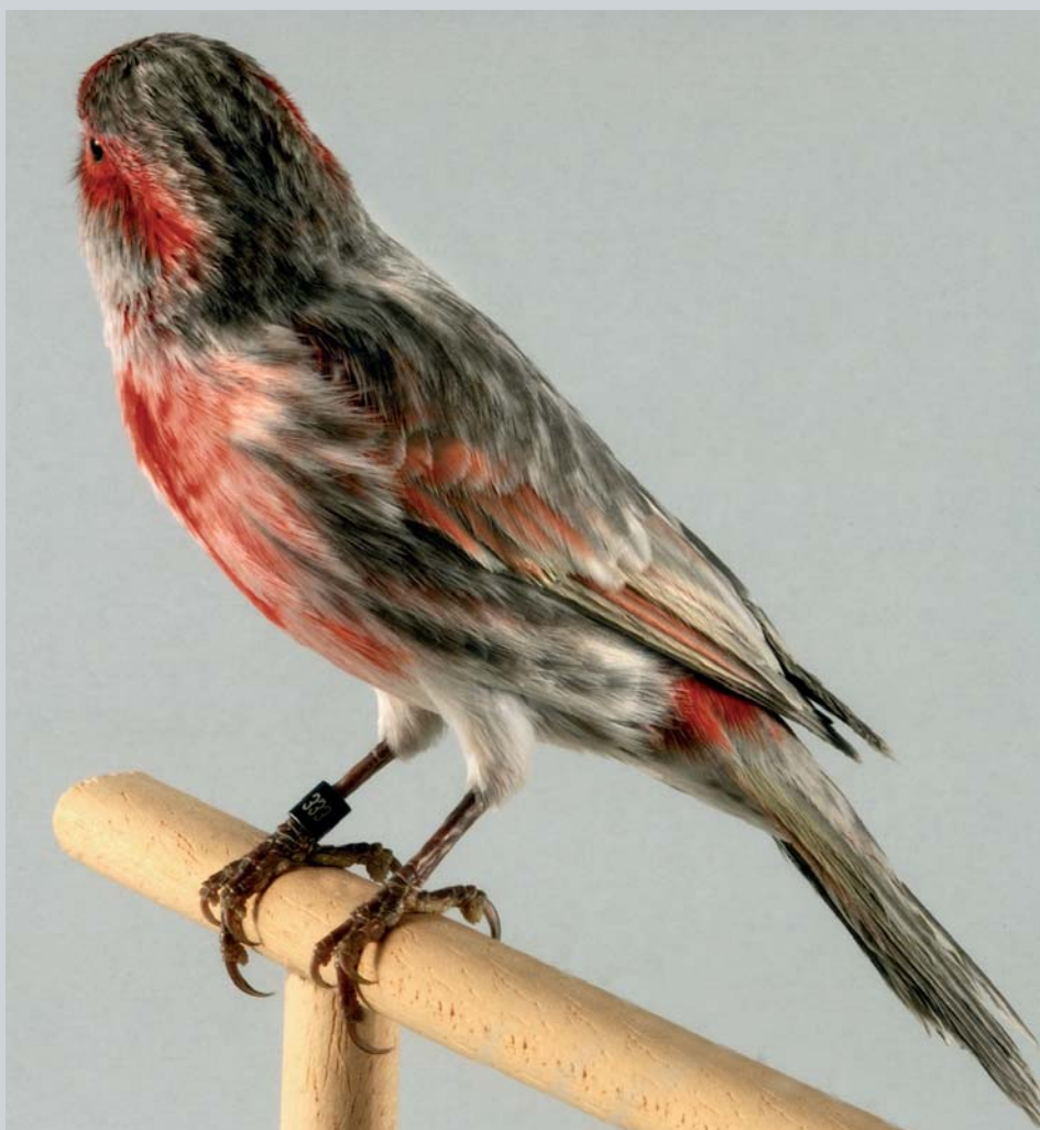
Nero opale rosso mosaico

Mi piace chiamare le cose con il loro nome, quindi vorrei chiarire che nel nero