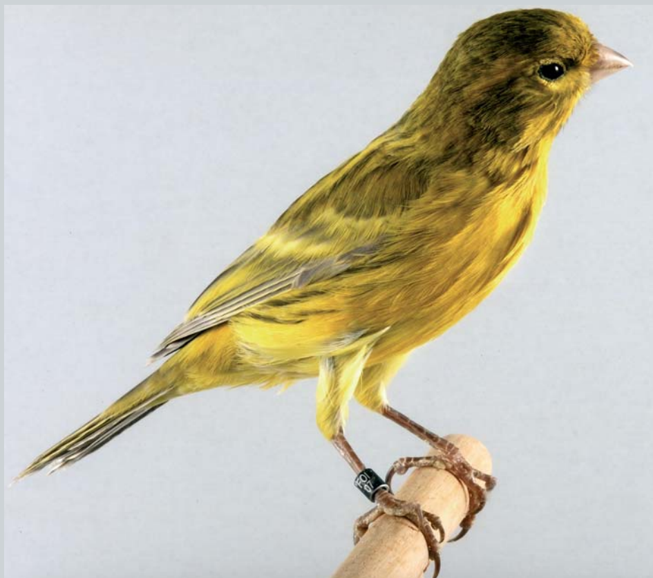
Nero opale giallo intenso