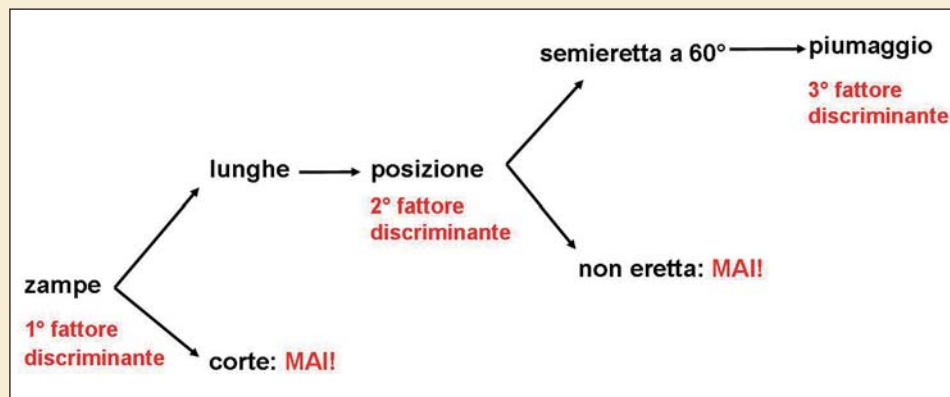
Diagramma di flusso da seguire durante il giudizio del Fife Fancy

frequente, è la spaccatura nel centro del petto, cosiddetto “petto a cuore”.