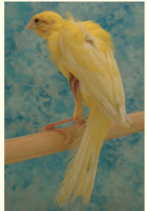
▲ Gibber italicus

Quindi, un buon posatoio rende sicuro e tenace l'appiglio degli arti inferiori, rendendo tranquillo ed equilibrato il soggiorno del Canarino nella sua nuova dimora, rilassandolo ed assicurandogli un'ottima