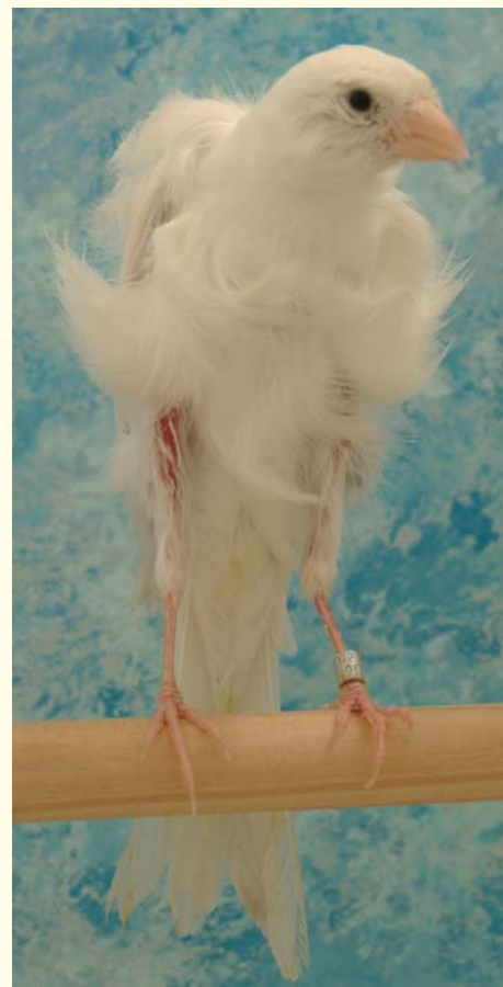
▲ Arricciato del Sud bianco

Questi canarini non sono, infatti, in grado di porre in massima estensione orizzontale o in quasi verticale il collo, né mostrano in tutto o in parte le principali arriccature. Né gli allevatori si preoccupano eccessivamente di "educarli" per cercare di ottenere al massimo grado un collo posto in orizzontale (forma di sette) oppure posto in quasi verticale (forma di uno), convinti che questi connotati principali sono inclusi nella "confezione" al momento dell'acquisto o della nascita dei soggetti. Tanto vale non preoccuparsene abbastanza, tanto o prima o poi arriveranno. I nostri amici allevatori di Malinois , Harzer , Timbrado sanno bene che un otti-